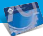
Tessera ACI Sistema