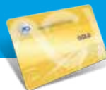
Tessera ACI Gold

ATTIVARE IL SERVIZIO È SEMPLICE: entra nel club ACI e sottoscrivi l'associazione tramite RID Bancario.