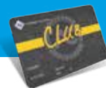
Tessera ACI Club